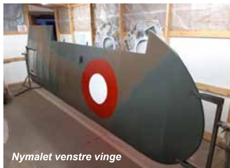
Nymalet venstre vinge

Med disse ting og papirarbejdet på plads, ser vi med både spænding og glæde, frem til at se Y-654/OY-AZZ i luften til foråret.