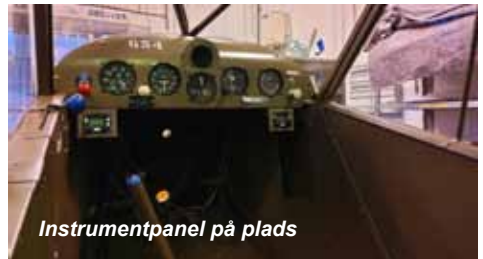
Instrumentpanel på plads

Det er Aalborg Lak og Farve A/S, der leveret lak til flyet. De har været meget interesseret i projektet og har ydet en meget professionel og hurtig støtte. Vi kan derfor anbefale andre at benytte dette firma.