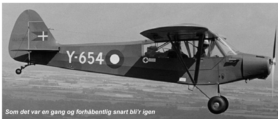
Som det var en gang og forhåbentlig snart bli'r igen

Når det er på plads skal kroppen flyttes fra vores sideværksted og ud i hangaren, hvor vinger, haleplaner og ror skal monteres, men så er vi, som nævnt nok henne i det tidlige forår 2023.