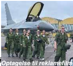
Optagelse til reklamefilm

Foto/film optagelser: Flere interessenter har fundet vej til hangaren, når der skal laves fotooptagelser, f. eks TV2, FMI og flere danse-grupper, der benytter flyene og området som kulisser ved optagelserne.