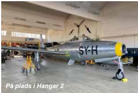
På plads i Hangar 2