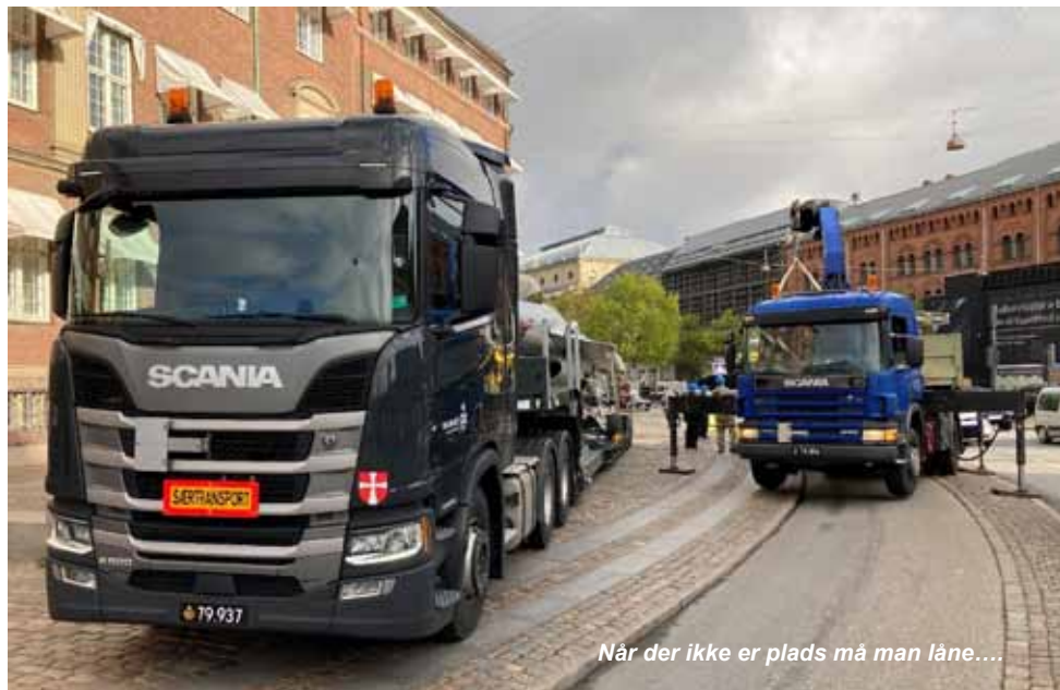
Når der ikke er plads må man låne....

De bedste ønsker om en god jul og et godt nytår.