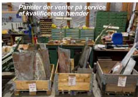
Paneler der venter på service af kvalificerede hænder

Og selv KLM var hjælpsomme, efter lidt overbevisning, med at bringe 2,9 meter lange stringers med hjem på en flyvemaskine, og minsandten om ikke de kom hele vejen til Ålborg og blev leveret først fra flyet, hvilken service.