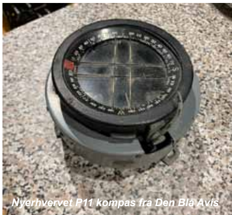
Nyerhvervet P11 kompas fra Den Blå Avis

Skulle der nu sidde nogle derude som har lyst til at lave lidt Harvard så siger I bare til !