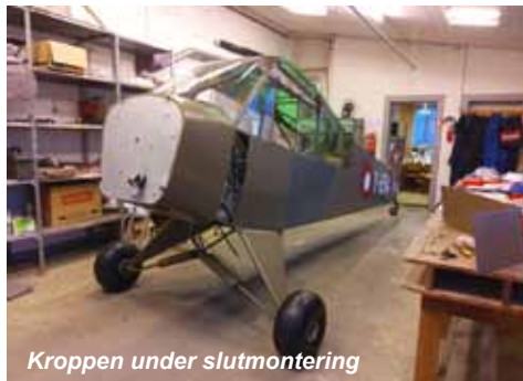
Kroppen under slutmontering