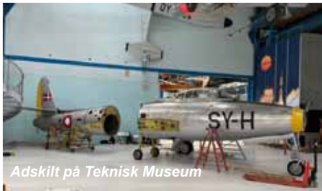
Adskilt på Teknisk Museum

Vingetankene er blevet malet tilbage til den oprindelige grønne farve.