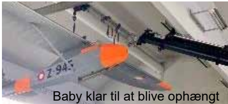
Baby klar til at blive ophængt

Svæveflyet er nu malet og korrekte decals påsat. Det er ophængt i hangaren, ved siden af Olympia svæveflyet.