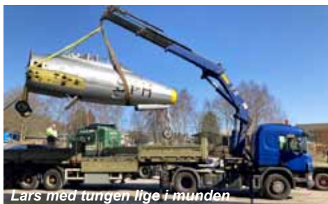
Lars med tungen lige i munden

Flyet blev flyttet fra DTM i Helsingør 24-25.04 til HG2 Værløse. Det er et led i flytningen af militære luftfartøjer fra DTM til HG2, grundet DTM fremtidige udflytningen til Svanemølleværket. Flytningen gik godt uden den store panik bortset fra en revnedannelse, som blev spottet i transportbeslaget til forkroppen på dagen for flytningen.