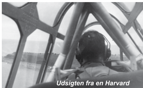
Udsigten fra en Harvard

Nu troede vi alle lige at Corona havde opbrugt alle de bespænd der kunne være, men Murphy (fra Murphy's law - alt hvad der kan gå galt, går galt ) - har ikke levet forgæves, så ud over at alle nitter i bagkroppen og alle grommets til Dzus fasteners skal byttes, så valgte formanden at brække sit knæ to steder (noget med sne og ski).