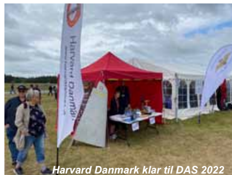
Harvard Danmark klar til DAS 2022

Det har vi alligevel ikke prøvet før, men det hjalp godt til når man nu skal købe maling!