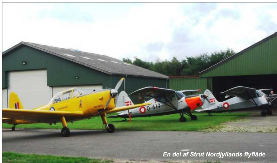
En del af Strut Nordjyllands flyflåde