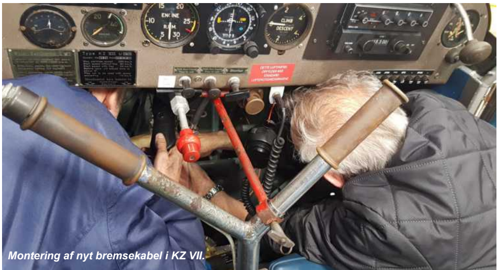
Montering af nyt bremsekabel i KZ VII.

Vi ser med håb frem til 2021, hvor vi forhåbentlig er kommet på den anden side af Corona, og glæder os til at kunne fremvise en flyvende KZ III i Flyvevåbnets bemaling.