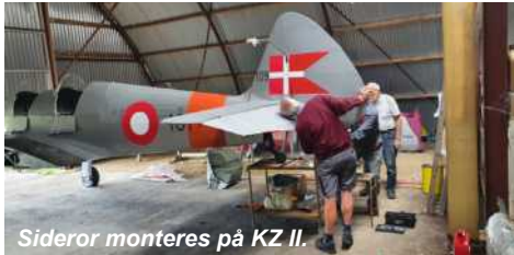
Sideror monteres på KZ II.