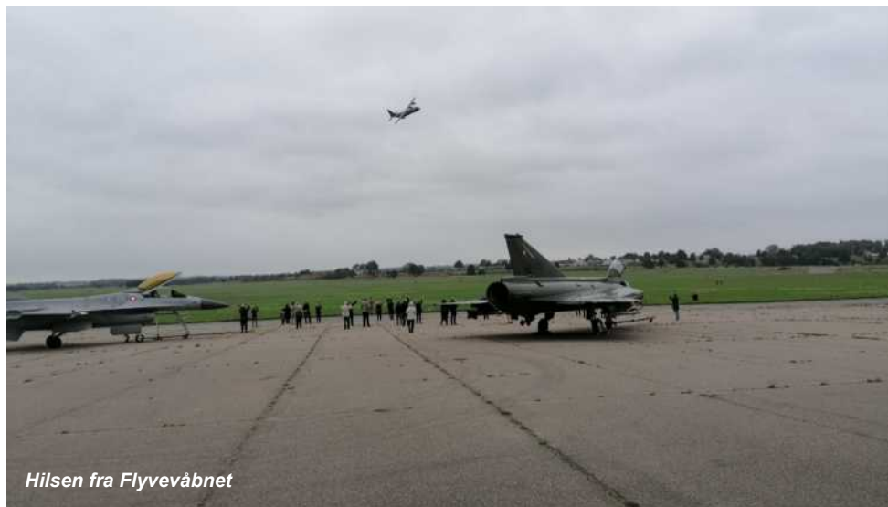
Hilsen fra Flyvevåbnet