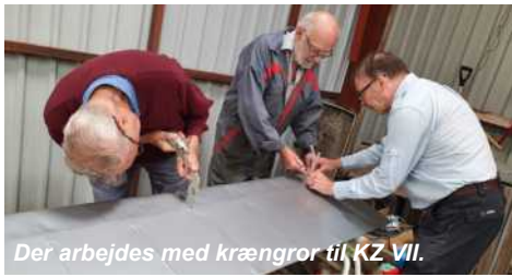
Der arbejdes med krængror til KZ VII.

Vi er så småt begyndt at sparke dæk på flyet, og skal til at gennemgå det nærmere, for at se hvad der egentlig skal til, for at få det luftdygtigt igen. Vi er flere der ser frem til den dag den igen må flyve i lufthavet over Danmark.