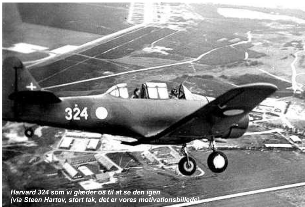
Harvard 324 som vi glæder os til at se den igen (via Steen Hartov, stort tak, det er vores motivationsbillede)