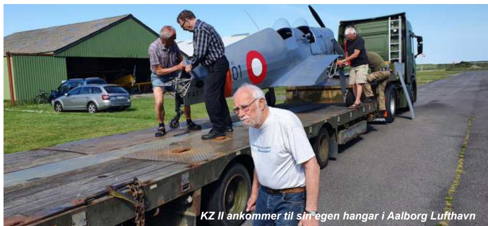
KZ II ankommer til sin egen hangar i Aalborg Lufthavn