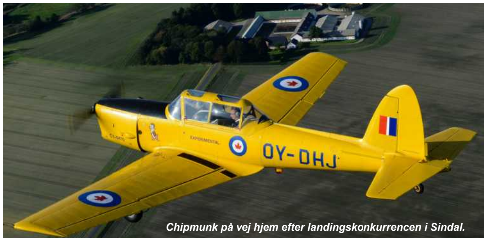
Chipmunk på vej hjem efter landingskonkurrencen i Sindal.

Når der lækker benzin fra stophanen ud i bunden af flyet løber det hele vejen fra den forreste del og helt tilbage til halepartiet.