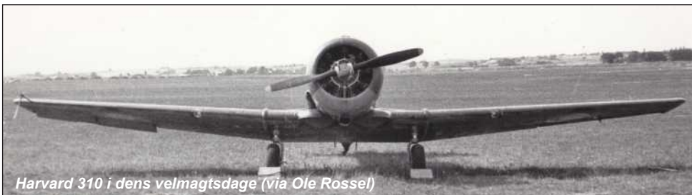
Harvard 310 i dens velmagtsdage