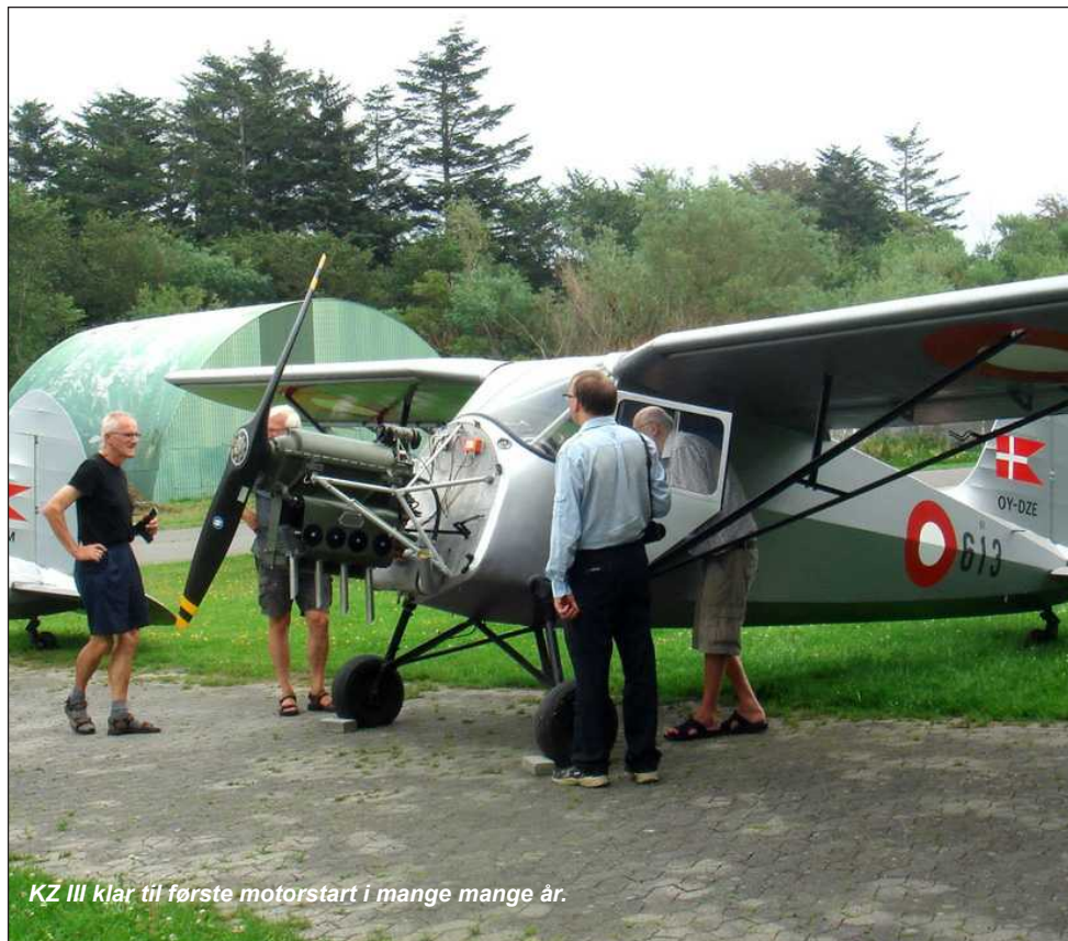
KZ III klar til første motorstart i mange mange år.