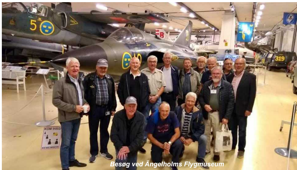
Besøg ved Ängelholms Flygmuseum

Efter frokost var der igen mulighed for at udforske hangaren og turen sluttede med fotografering sammen med vore gode guider. Tak for et godt besøg