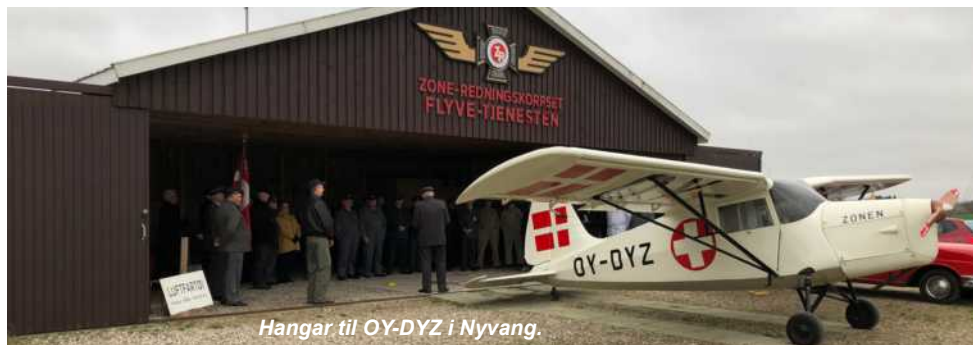
Hangar til OY-DYZ i Nyvang.

Desværre er området ikke mere 500 x 500 meter, som det oprindeligt var i 1917, idet det blev halveret af motorvejen over Avedøre til Amager. Der er dog stadig ca. 10 ha. tilbage at boltre sig på, og vi er overbeviste om, at der i fremtiden vil ske spændende ting på Avedøre Flyveplads, udover det som AAA kan præstere.