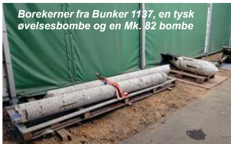
Borekerner fra Bunker 1137, en tysk øvelsesbombe og en Mk. 82 bombe

I forbindelse med Flyvevåbnets 70'års fødselsdag 1. oktober har museet hjulpet Karup Lokalhistoriske Samling med deres udstilling på Karup Bibliotek.