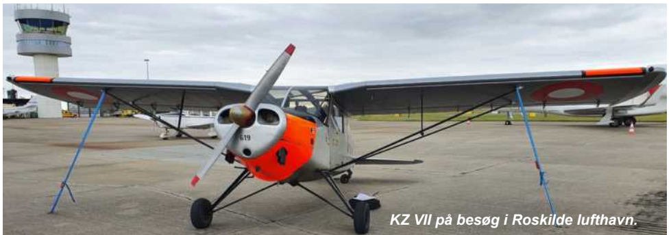
KZ VII på besøg i Roskilde lufthavn.

Sidste år havde vi en del problemer med at den ene vingetank var utæt. Efter et par ture over Atlanten blev det problem endelig løst. I år har vi arbejdet med at få en benzinlækage ved benzinhanen ordnet.