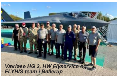
Værløse HG 2, HW Flyservice og FLYHIS team i Ballerup

En skalamodel i 1:1 af et F-35 kampfly, bygget af EDM Limited i UK, benævnt F-35 Mock-up. Planlagt ankomst midt i juli, men blev rykket til 17. AUG i stedet.