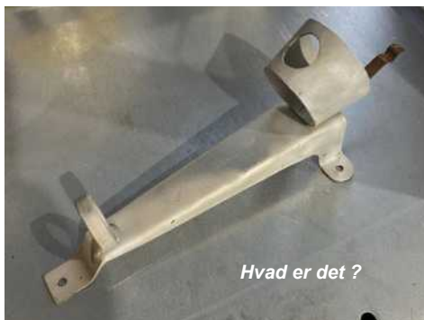
Hvad er det ?

Hvad ser vi på dette billede? Harvard piloter/mekanikere må ikke svare. Se svaret til sidst.