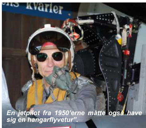
En jetpilot fra 1950'erne måtte også have sig en hangarflyvetur".