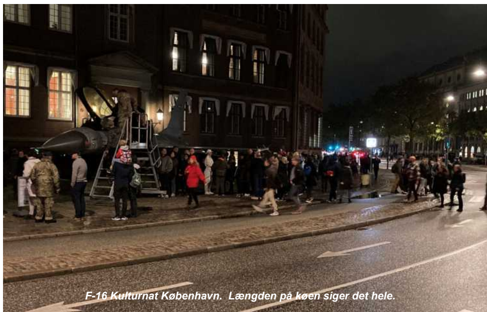
F-16 Kulturnat København. Længden på køen siger det hele.