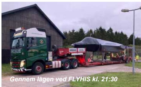
Gennem lågen ved FLYHIS kl. 21:30

Flyet står nu i Aalborg og med respekt for donationerne og salg bliver det forhåbentligt frigivet til bevarelse for eftertiden.