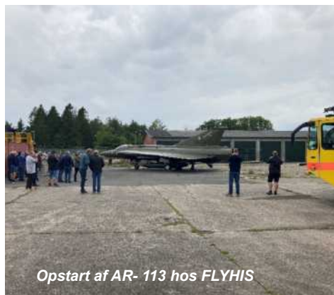
Opstart af AR- 113 hos FLYHIS