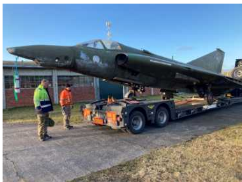
Lars og Knud beskuer AR-102 efter en veloverstået transport til FLYHIS.

Vi startede med AR-102 på Tønder flyveplads. Flyet var i så dårlig stand at en renovering ikke var mulig. Cockpittet vil dog blive anvendt til udstilling på Gedhusmuseet ved hjælp af nyt canopy og windscreen.