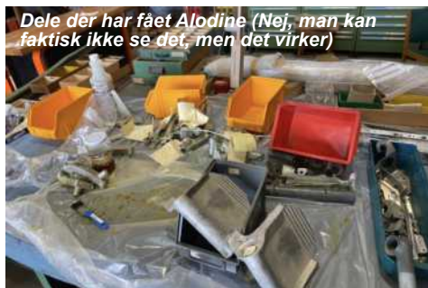
Dele der har fået Alodine (Nej, man kan faktisk ikke se det, men det virker)

Stor donation Et af vores medlemmer er kommet med en større donation af forbrugsvarer.