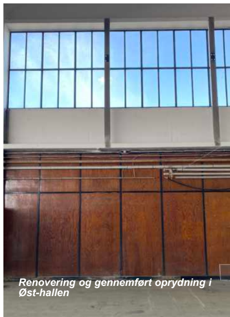
Renovering og gennemført oprydning i Øst-hallen

Fly-bygger projekterne i Værløse ligger også i Øst-hallen, og består pt. af en enkelt bygger, som er i fuld gang med vinger, beklædning af krop og motorrenovering. Særligt tiltrækning af andre / flere flybyggerprojekter har fokus i 2024, da der nu er bedre plads til disse kerne-aktiviteter.