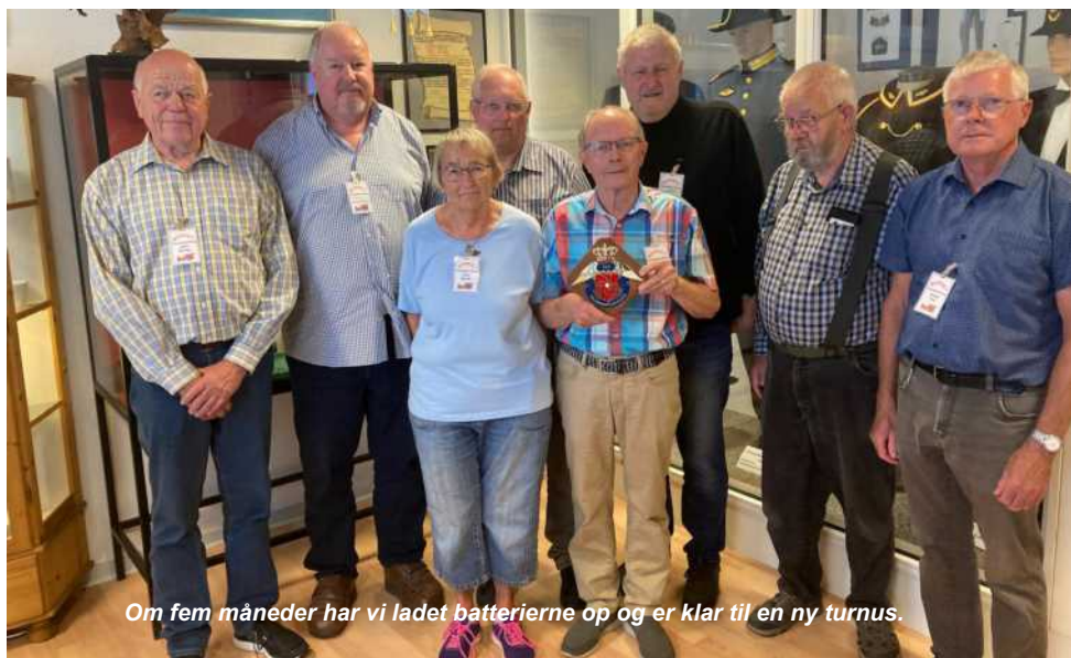
Om fem måneder har vi ladet batterierne op og er klar til en ny turmus.