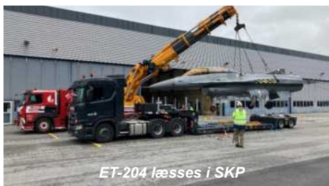
ET-204 læsses i SKP

25. MAJ flyttede vi ET-204 fra Fighter Wing AMS til FVT Aalborg. ET-204 er Danmarks første F-16 som vi har ønsket til FLYHIS for bevarelse for eftertiden. Vi var informeret fra FMI's side at flyet stod med motor i, hvilket er afgørende for hvordan det skal løftes mht. tyngdepunktet.