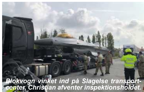
Blokvogn vinket ind på Slagelse transportcenter, Christian afventer inspektionsholdet.

Ros til Team tordenjet for at kunne overtage flyet på en Flådestation og få den samlet ved hjælp af ekstern assistance i en periode med mange transporter.