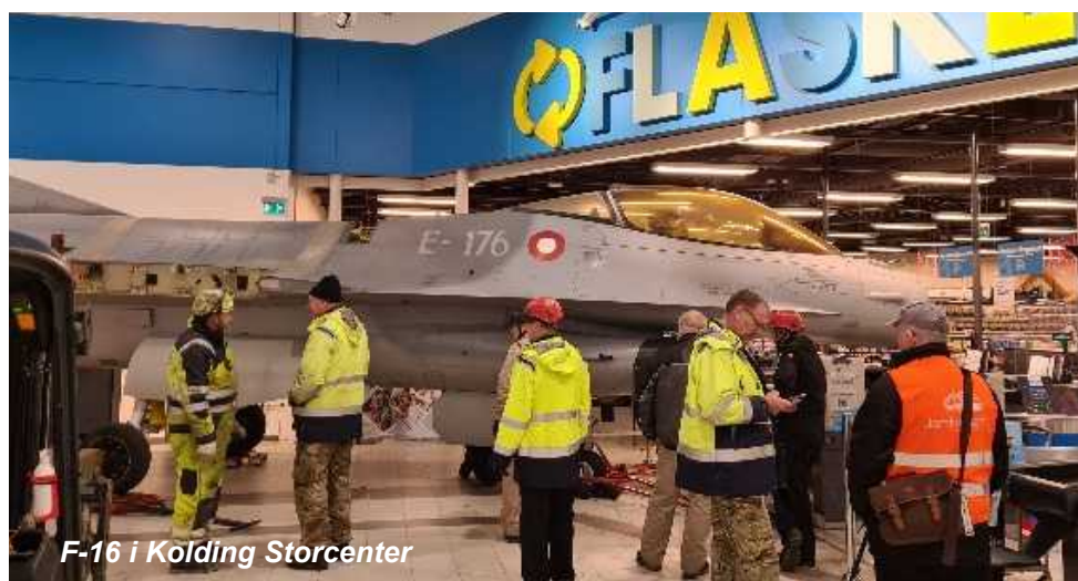
F-16 i Kolding Storcenter

Opstillingen af flyet skulle ske d. 6. marts, efter kl. 19, for at undgå at der var for mange kunder i centeret.