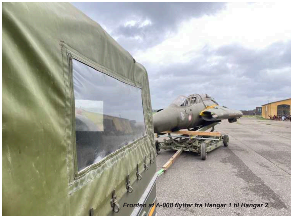
Fronten af A-008 flytter fra Hangar 1 til Hangar 2

Samarbejdet med FLYHIS har været en grundsten i arbejdet i Hangar 2, og vi håber, at vi kan vedblive og fastholde relevansen af at være et militært flyhistorisk vindue i Øst Danmark for Flyvevåbnet.