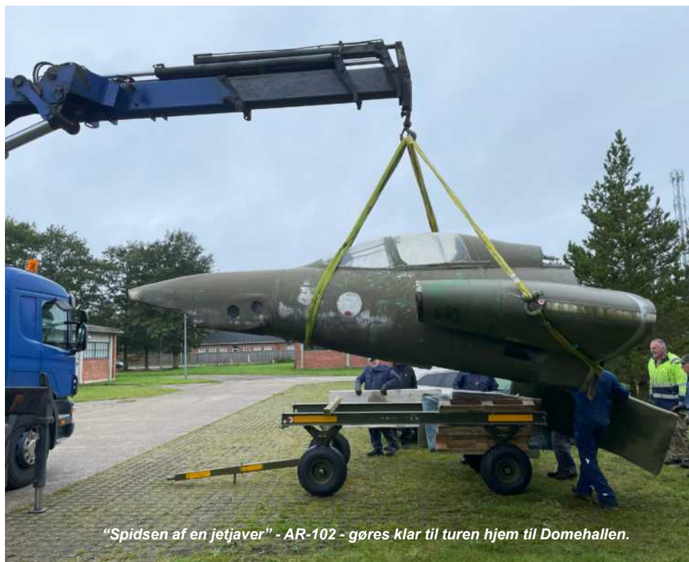
"Spidsen af en jetjæver" - AR-102 - gøres klar til turen hjem til Domehallen.