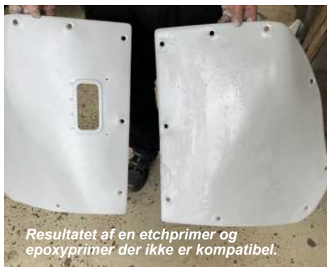
Resultatet af en etchprimer og epoxyprimer der ikke er kompatibel.