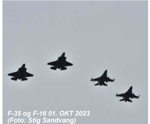
F-35 og F-16 01. OKT 2023

Imidlertid skulle de udstillede fly pludselig stå i udstillingsområdet tre dage før arrangementet, grundet sikkerheds gennemgang i området. Derfor måtte vi stable et for-kommando på benene allerede tirsdag til onsdag.