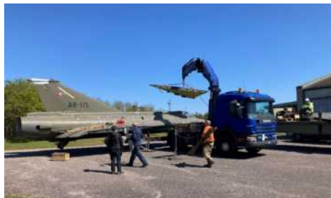
En fin forårsdag på Stevns til montering af vinger på AR-115

En opbygning er pågående. Brændstoff-tankene viste sig dog at være tætte, og vil kunne anvendes til de fly som Draken Team Karup vedligeholder. Teamet har faktisk udskiftet en utæt tank sidste vinter på AT-158.