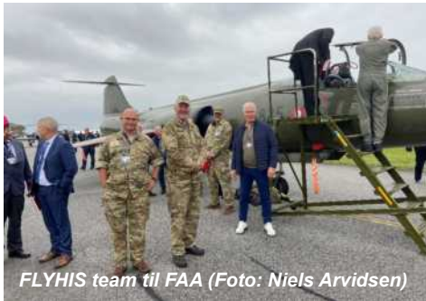
FLYHIS team til FAA