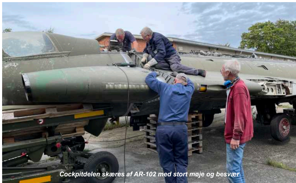
Cockpitdelen skæres af AR-102 med stort møje og besvær