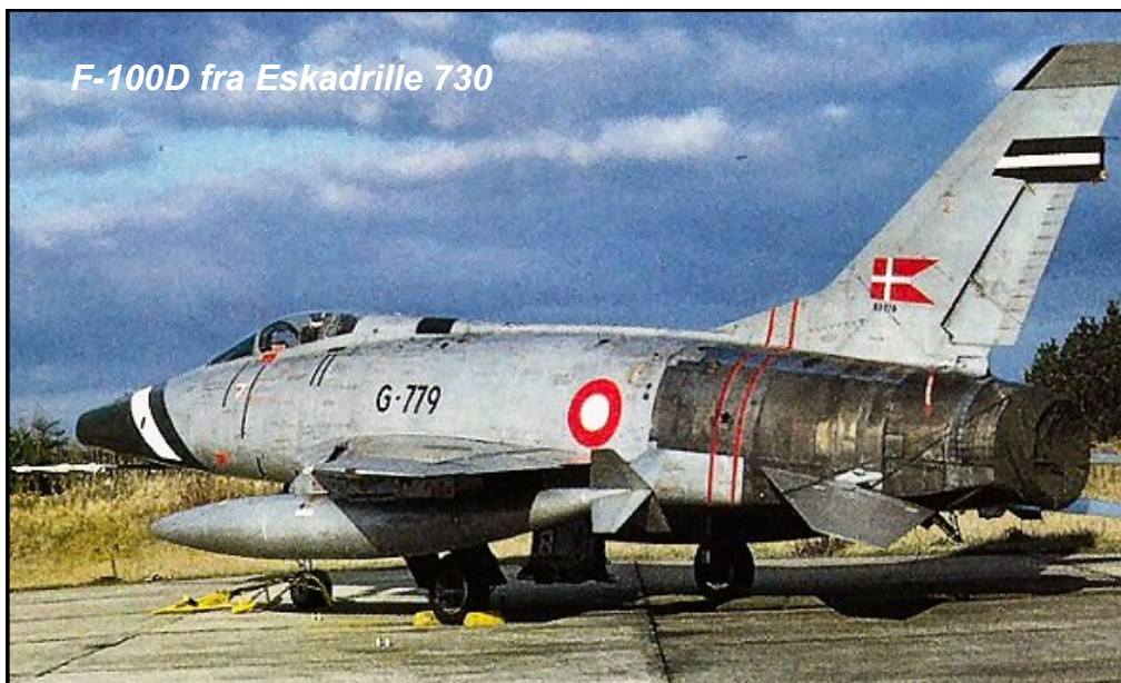
F-100D fra Eskadrille 730

var der ikke længere så stor tilslutning til hver onsdag at arbejde i Billund.