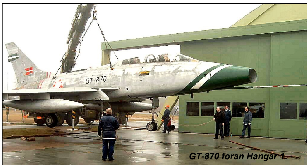
GT-870 foran Hangar 1

Heldigvis var evnen til forhandling og lysten til at se mulighederne i de mange forslag til stede. Resultatet blev, at TEAM TORDENJET's flygruppe skulle flytte ind i Hangar 1. Den gamle hangar er bygget under 2. Verdenskrig af den tyske værne-magt og placeret i et område nord for Ribe Landevej. Flygruppen kunne påbegynde indflytningen den 15. september 2004. Efterfølgende fik man istandsat og indrettet sig i hangaren. HISA fik tildelt en del af Byg-