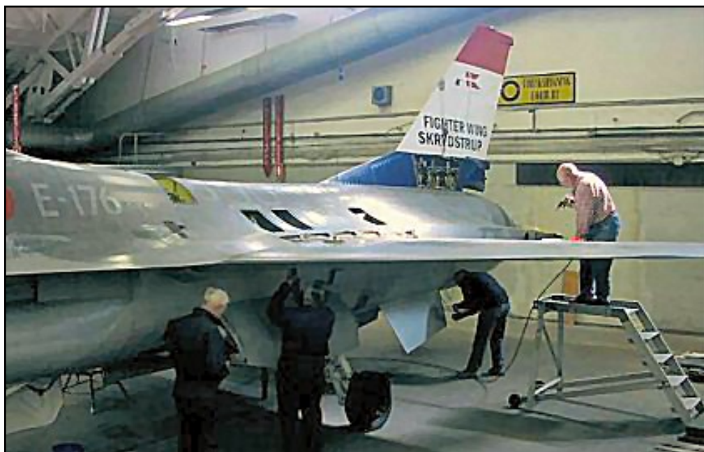
E-176 modificeres til en "Saml-let" version.

og opmagasinering. Sideløbende med flytningen blev der fra nær og fjern leveret museale genstande i en lind strøm. Under de ideelle forhold i Hangar 1 skred arbejdet imens fremad med restaureringen af de forskellige fly.