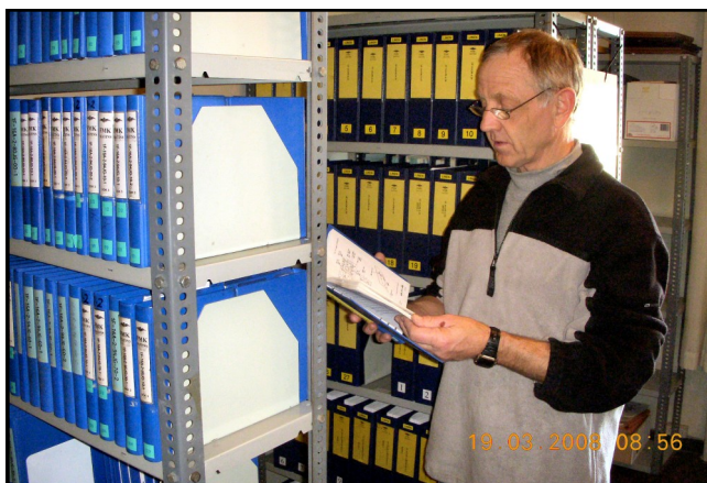
Kaj arbejder med bøgerne

ning 349, en af flyvestationens belægningsbygninger med mange rum. Onsdag den 18. august 2004 begyndte så indflytningen.