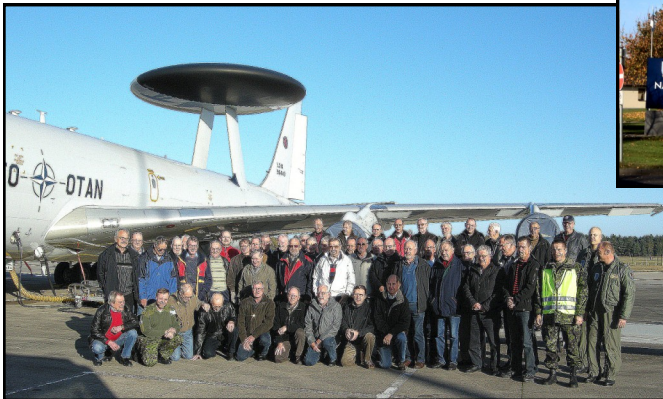
I Geilenkirchen 2009