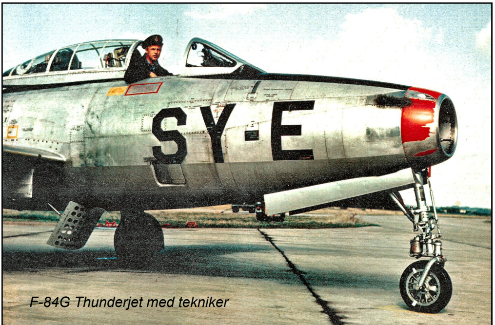
F-84G Thunderjet med tekniker

Der var en del problemer med restaureringen af et mindre transportfly, en Pembroke, som var placeret i Hangar 2 på flyvestationen. Samtidig