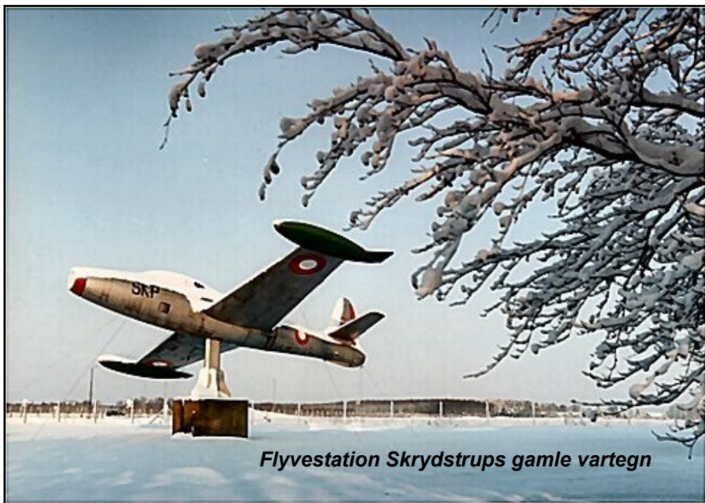
Flyvestation Skrydstrups gamle vartegn