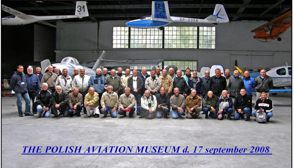
THE POLISH AVIATION MUSEUM d. 17 september 2008