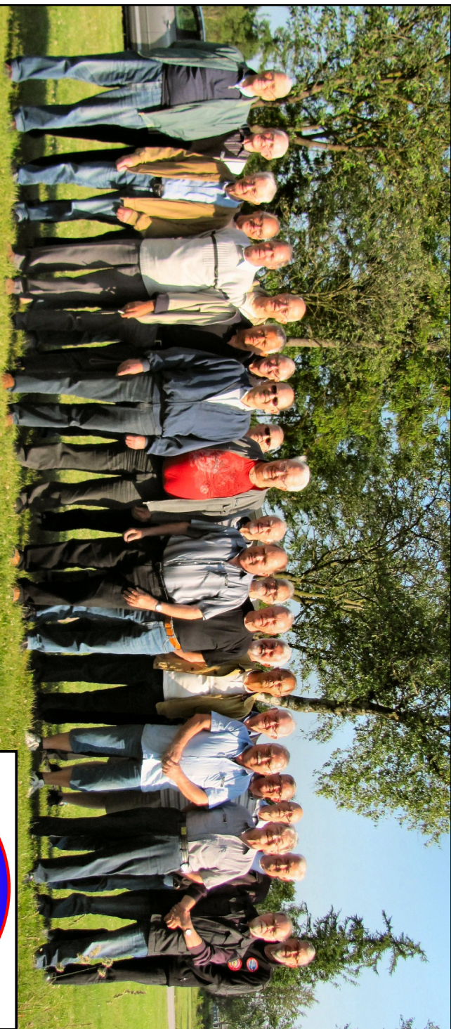
Team Tordenjet 20. juni 2012

Vi er altid åbne for nye medlemmer, der vil gøre en indsats for flyvestationens lokalhistorie. Er du pensioneret, og måske har interesse for sagen, så kig en onsdag.